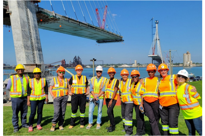
Recorrido por el emplazamiento del proyecto en Canadá, con participantes de Women's Enterprise Skills Training of Windsor (WEST), en julio de 2023.