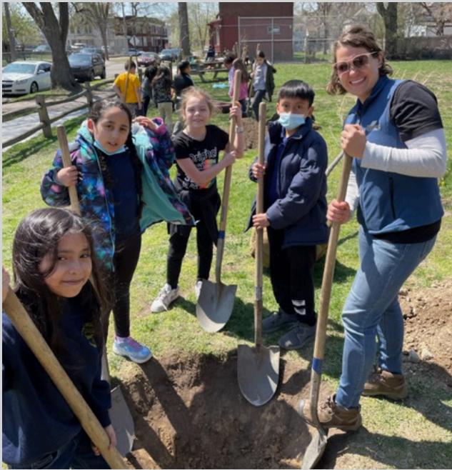
El programa TreeKeepers Kids plantó 26 árboles en Delray/suroeste de Detroit en la primavera de 2023.