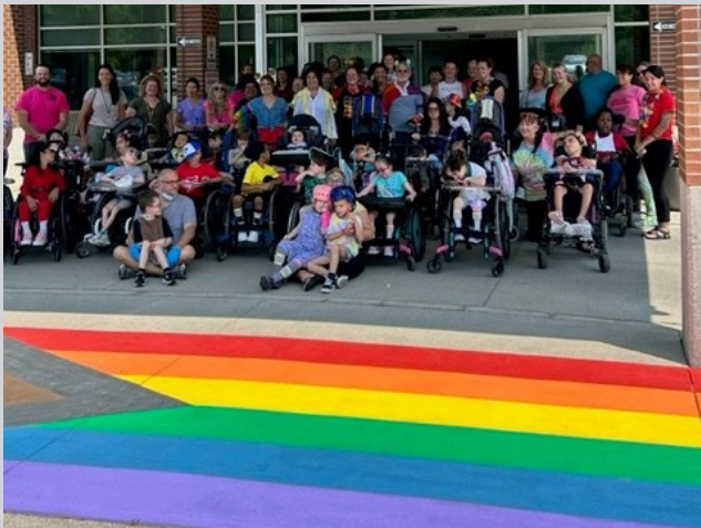
La entrada principal del Centro Infantil John McGivney está pintada con los colores de la bandera progresista del arco iris.