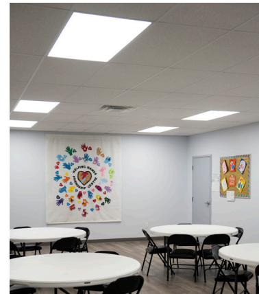
Un nuevo techo desplegable en el Helping Hands Friendship Centre proporciona un espacio cómodo para los participantes.