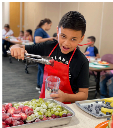
Más de 100 jóvenes del suroeste de Detroit aprendieron sobre nutrición y alimentación sana durante las clases de cocina de CHASS.

Derecha: Arte creado durante la arteterapia en Journey Home Hospice en Sándwich.