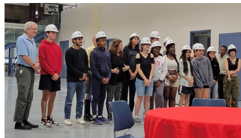
La ceremonia hard hat de la Universidad de Detroit Mercy en septiembre de 2023.